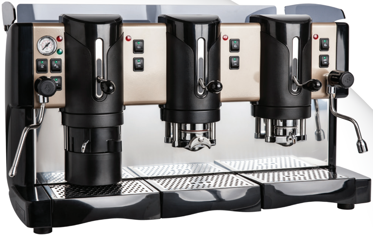
JJ Hybrid CP